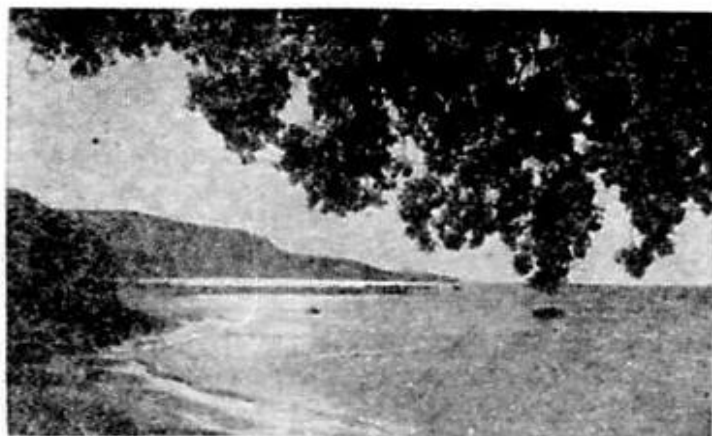
Costa de argint